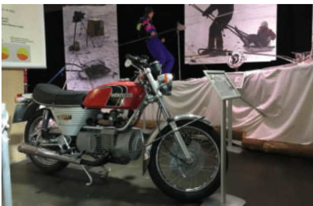
Hercules W2000 - Das erste Motorrad mit Wankelmotor