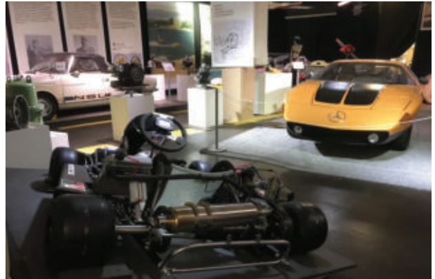
Weiterhin zu sehen Mercedes C 111 und NSU/Wankel-Spider