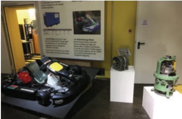
Neu in der Ausstellung: Wankel Renn-Kart mit dem auch schon Michael Schumacher und Heinz-Harald Frentzen gefahren sind.