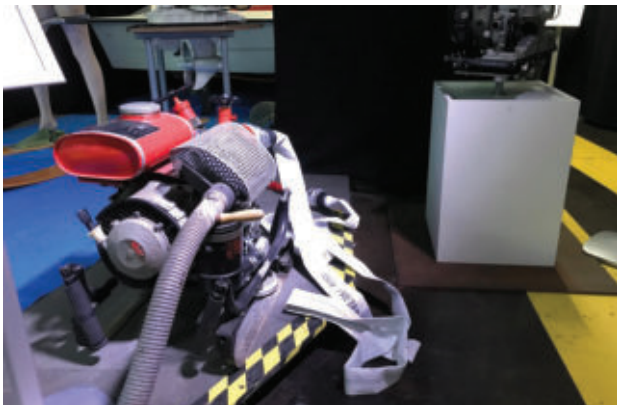
Feuerwehr Tragkraftspritze mit Sachs-Wankelmotor