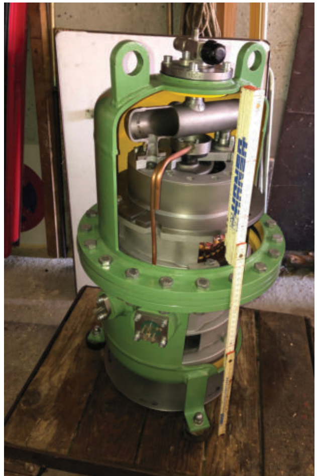
Ebenfalls neu in der Ausstellung: Wankel Kompressor