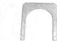
Zweiteilige Buchse und Sicherungsbügel

Und damit alles schön fest sitzen bleibt, wird noch der Bügel mit einer Kneifzange ringförmig in die Sicherungsnut zusammengezogen. (Ein Sicherungsring nach DIN 471 scheidet hier aus. Die große Verformung bei der Montage würde er nicht mitmachen.) Fertig!