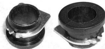
Zweiteilige nachgefertigte Buchse

Der Montageaufwand beträgt ca. eine halbe Stunde. Eine Hebebühne ist dabei sehr hilfreich.