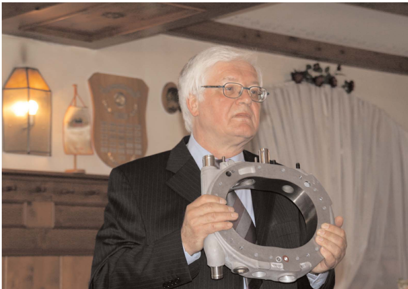
Die ersten nachgefertigten NSU Wankel-Spider-Trochoiden wurden beim Pfingsttreffen 2006 in Diepersdorf verkauft.