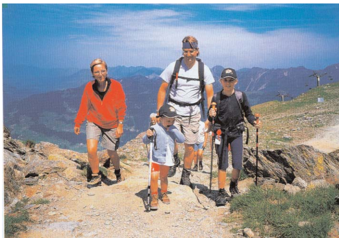
Eine Wanderung mit Spider-Freunden ist am Sonntag angesagt

Sonntags werden wir dann einen gemütlichen, autofreien Tag einlegen. Ganz nach individuellem Befinden kann