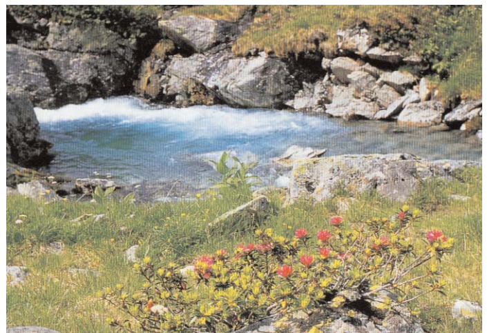
Die Ursprünge der Bergquellen werden mit dem Spider erkundet werden