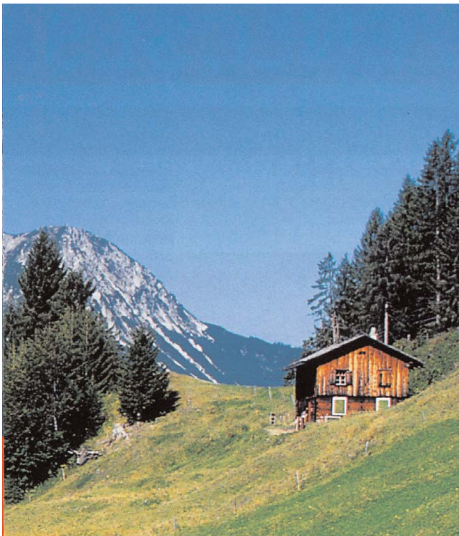
Traumhafte Landschaft zum Spider fahren und wandern

Für unserer Wohnmobilisten werden Stellplätze in der Nähe des Hotels zur Verfügung gestellt. Für Anhänger und Fahrzeuge aller Art sind ausreichend Stellplätze in fußläufiger Nähe zum Hotel vorhanden. Die Kosten für Übernachtung und Verpflegung im Gasthof Vermala werden sehr moderat ausfallen. Wer vom 29.09. bis 3.10. buchen wird, hat für Übernachtung mit Frühstücksbuffet, Vier-Gänge-Abendmenü und Benutzung des Wellnessbereiches mit einem Preis von 33,- pro Person und Tag zu rechnen. Bei kürzeren Aufenthaltszeiten ist mit einem geringen Zuschlag von 3,- bzw. 5,- pro Tag zu rechnen. Für unsere Wohnmobilisten kann ein Frühstücksbuffet von 8,- und das Abendmenü um 16,- angeboten werden.