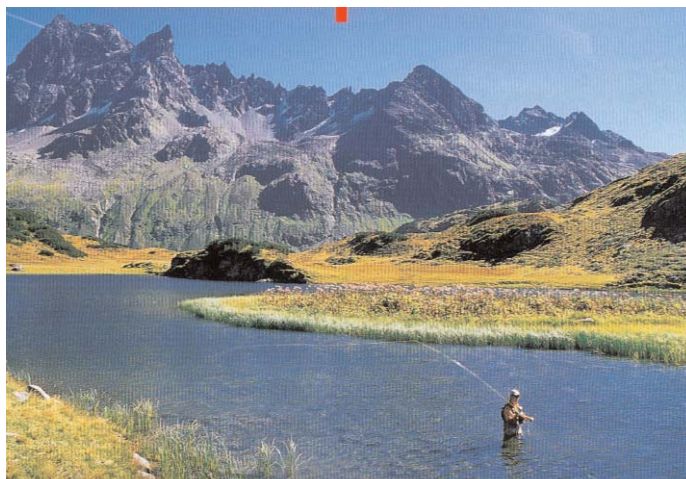
Und jeder hat auch die gelegenheit, eigene Interessen wahr zu nehmen