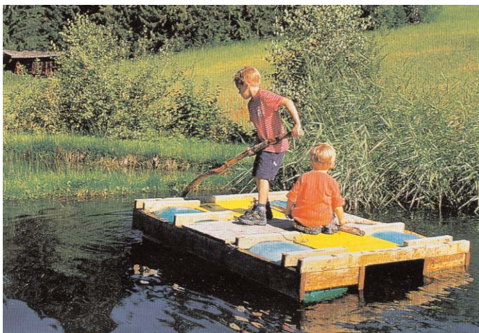
Natürlich wird auch der Spaß nicht zu kurz kommen