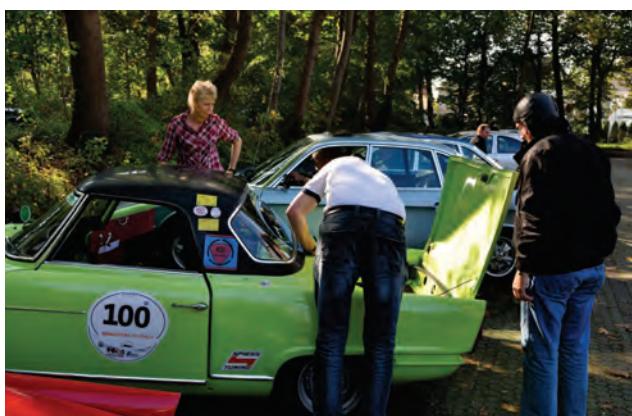
Ist da wirklich ein Wankelmotor drin?