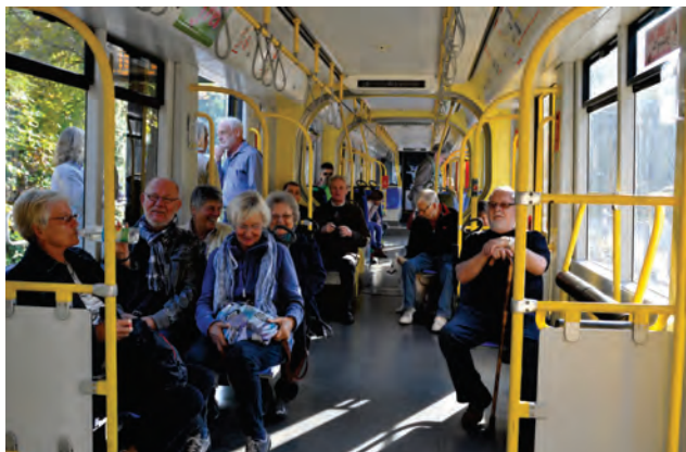
Auf geht's nach Köln