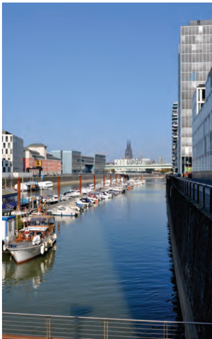
Blick auf den Kölner Dom