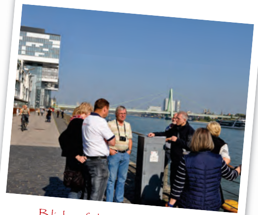
Blick auf die drei Kranhäuser

dustrie- und Arbeitsmaschinen her. Schwere Achsen (Achslast über 5,5 t) für LKW-Anhänger und Auflieger bilden den Schwerpunkt der Produktion. Die Produktpalette reicht von Achsen mit Scheiben- und Trommelbremsen über Luft- und Blattfederungen bis hin zu Telematikanwendungen für das Flottenmanagement. Mit mehr als 12 Millionen verkauften Achsen und rund 100 patentierten Erfindungen ist BPW in der Branche Marktführer in Europa. Die Besichtigung war jedoch keine Werksführung der Produktion, sondern eine Reise durch die Historie von Achsen und Rädern. Hierfür hat der Firmenchef sehr viele Exponate gesammelt um dem Besucher eine interessante und lehrreiche Reise von dem ersten Ochsenwagen bis in die Zukunft der Karbonachsen zu ermöglichen. Nach dem Besuch des Museums waren sich alle einig, dass „einfache“ Anhänger-Achsen deutlich komplizierter und aufwändiger sind, als sie auf den ersten Blick aussehen. Nach der Werksbesichtigung hatte bei strahlend blauem Himmel die Sonne so viel Kraft, dass es für die Spider „oben ohne“ weiter ging. Eine Ausfahrt die um die nahegelegenen Stauseen führte und mit 1000 Kurven und sehr vielen Höhenmeter ideal war für eine Ausfahrt Anfang Oktober. Hierfür hatte unser Vorsitzender Ulrich Latus aus Tübingen extra seinen Rennspider mitgebracht. Im sanften grün war dieser nicht nur ein Hingucker für die Spider-Freunde, sondern auch für alle gut gelaun-