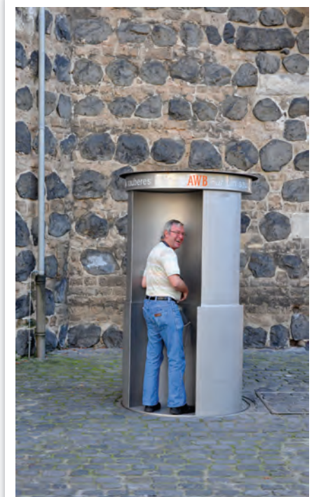
In Köln denkt man an alles