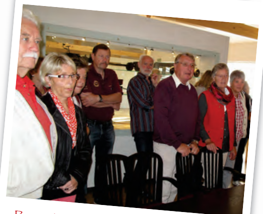
Besuch bei den „Bergischen Achsen“