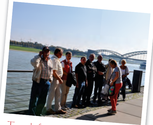
Traumhaftes Wetter am Rheinauhafen