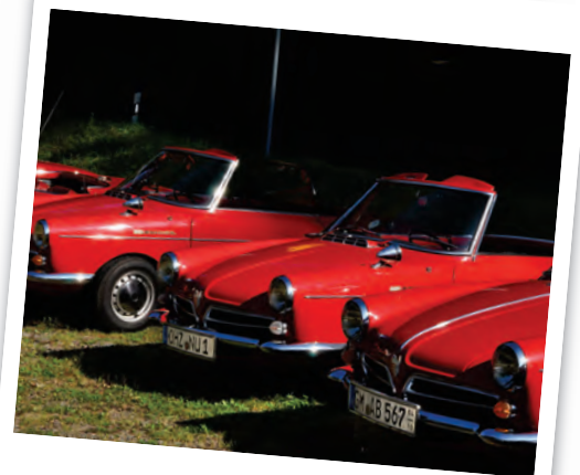
Spider on Tour