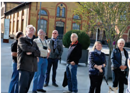
Blick auf die Kranhäuser