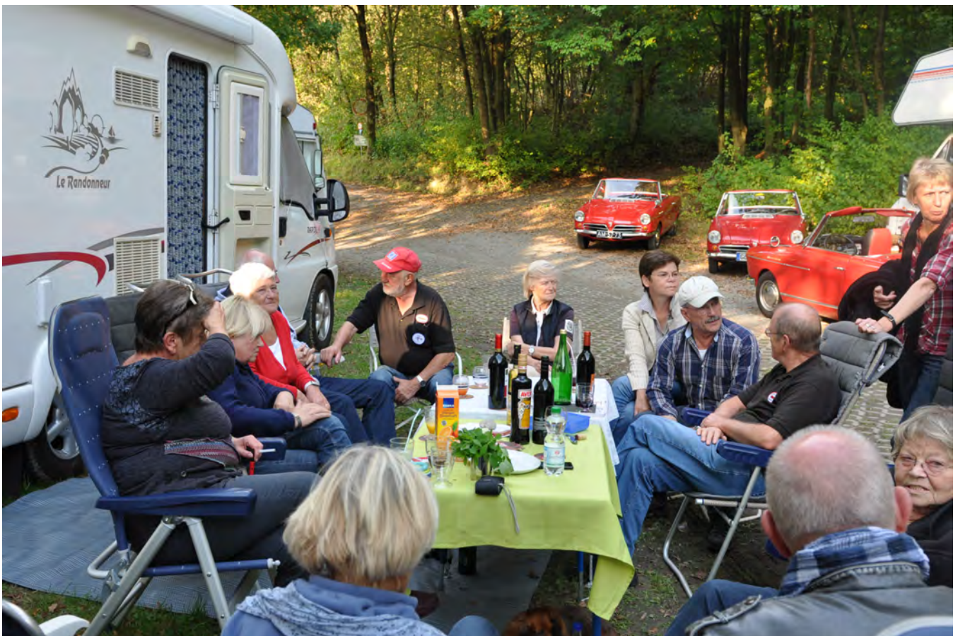
Auch die Wohnmobilsten hatten Spaß beim Herbsttreffen!