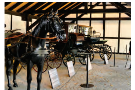
Kutschen haben auch Achsen