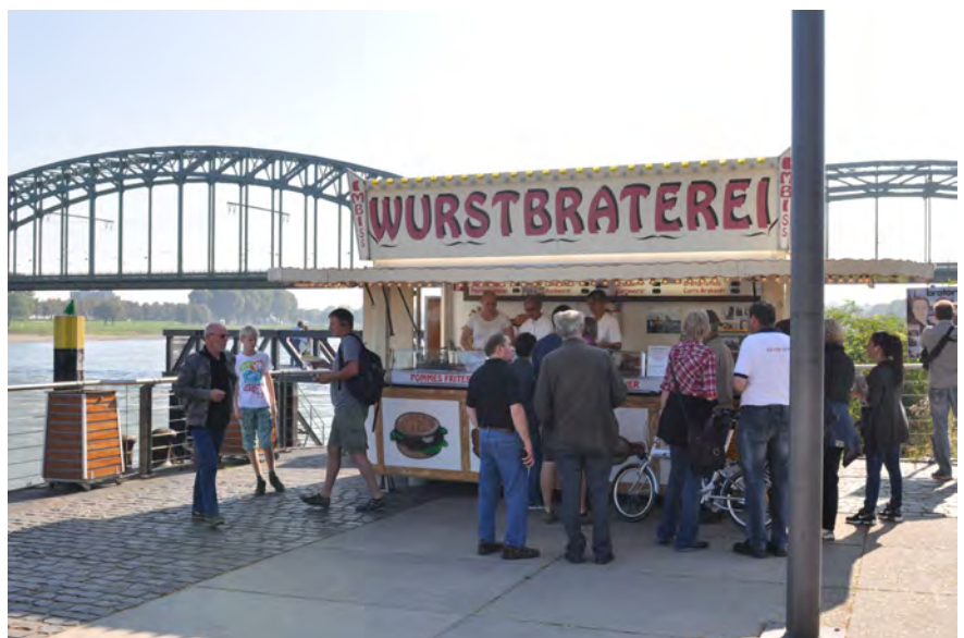
Die Wurstbraterie aus dem Kölner Tatort

der Welt. Der Ausbau der Uferpromenade erfolgte bis November 2009. Insgesamt erinnern 6 unter Denkmalschutz stehende Hafenkranne an die frühere Hafenfunktion mit ehemals 41 Kränen. Nach weiteren Umgestaltungen fand die Eröffnung des Rheinauhafens am 21. Juni 2014 (kurz vor unserem Spider-Treffen) statt. Am auffälligstem und schon von weitem sichtbar sind die drei Kranhäuser. Sie sind der Blickfang des Rheinauhafens und prägen das moderne Kölner Stadtbild. Diese heißen so, weil sie einem Hafenkran nachempfunden wurden. Bei der architektonisch wie optisch spektakulären Gebäudeform ragt