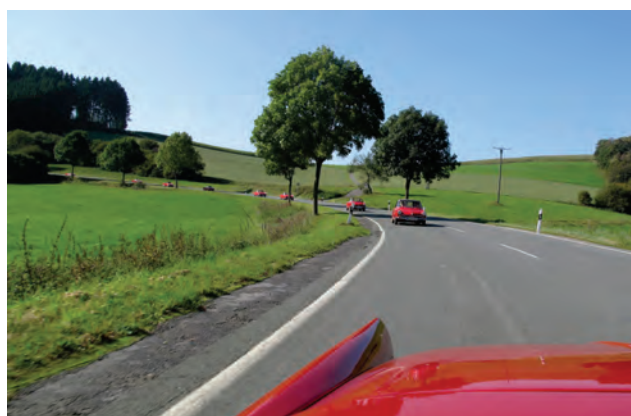
Ausfahrt bei traumhaftem Wetter