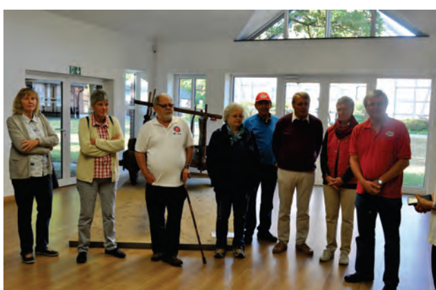
Besuch im Werk „Bergische Achsen“